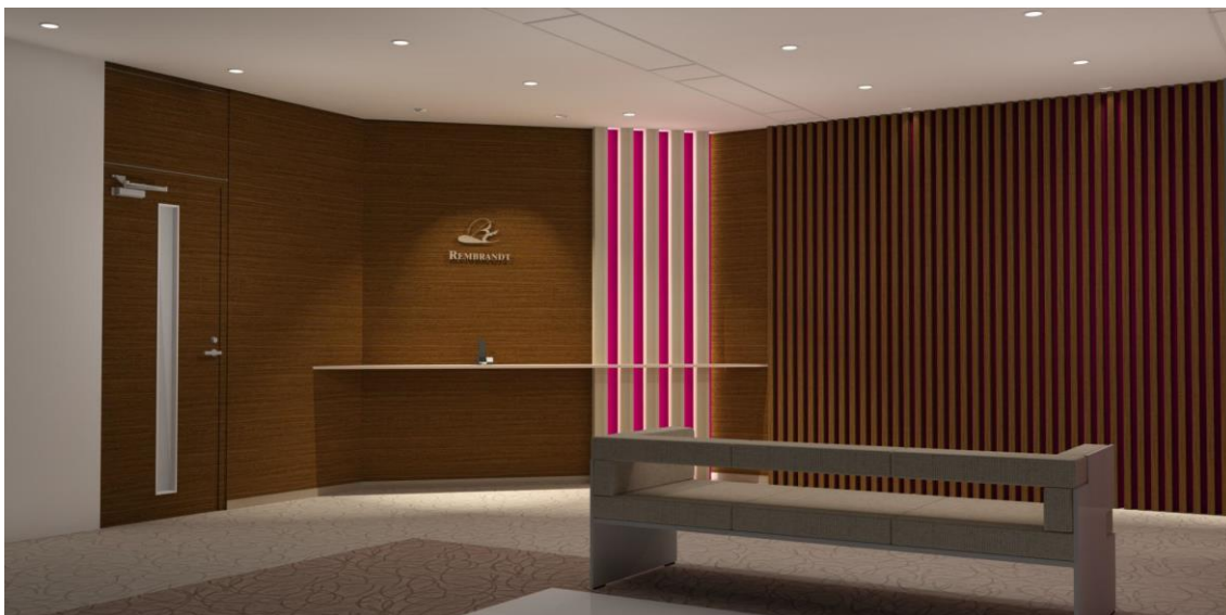
※エントランスイメージ

今回の新オフィスのデザインは、「お客様をお迎えする華やかな空間であると同時に、従業員が落ち着いて過ごせる様な日常の空間」というデザインコンセプトになっております。また、レンブラントホテルの由来でもあるオランダの画家レンブラントが描くような光と影を生み出す空間とホテルのフロントをイメージした落ち着いたデザインになっております。